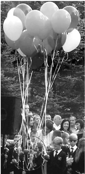
Rugsėjo 1-osios dangus pasi-puošė „vienuoliečių“ paleistais balionais.