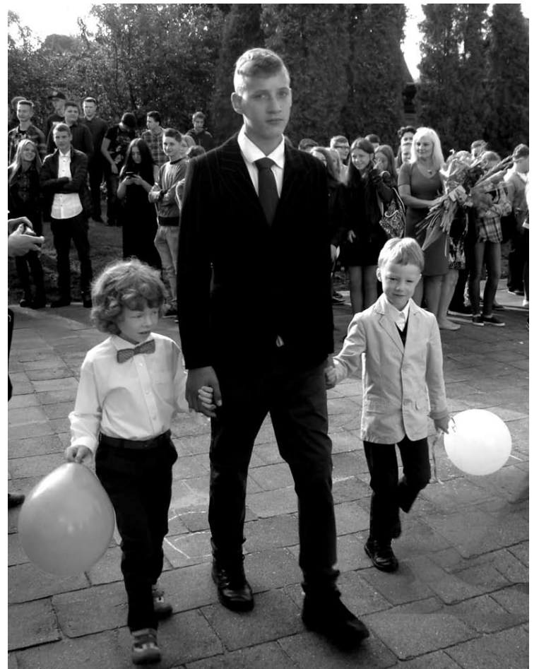
Įsikibus į dešimtokų rankas, pirmieji žingsniai į mokyklą kur kas drąsesni...