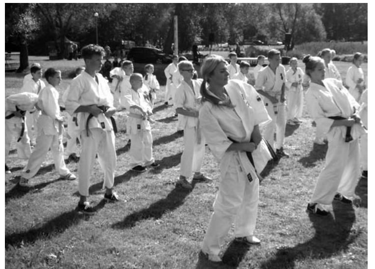
Anykščių miesto parke vyko neformaliojo vaikų švietimo mugė, kurioje buvo pristatomos įvairios užklausinės veiklos...