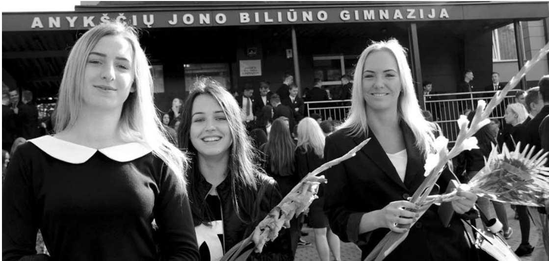
Anykščių J. Biliūno gimnazija vėl pilna klegesio ir šypsenų.

Saulėtą ketvirtadienio rytmetį mokyklų kiemai skambėjo nuo vaikų klegesio, rankose žydėjo spalvingi gėlių žiedai, dėmesį mokyklų bendruomenėms parodė rajono vadovai, politikai, dvasininkai.