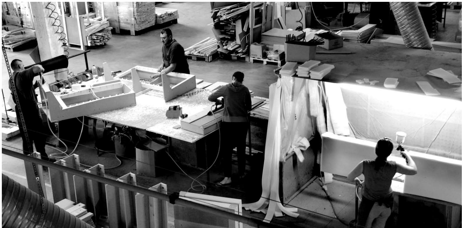
Į Katlėrių baldų surinkimo cechą suvežamos atskiros minkštų baldų detalės, iš kurių darbininkai surenka gaminius.