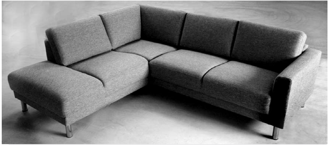
Didžioji dalis AB „Balticsofa“ produkcijos eksportuojama į Skandinavijos šalis.